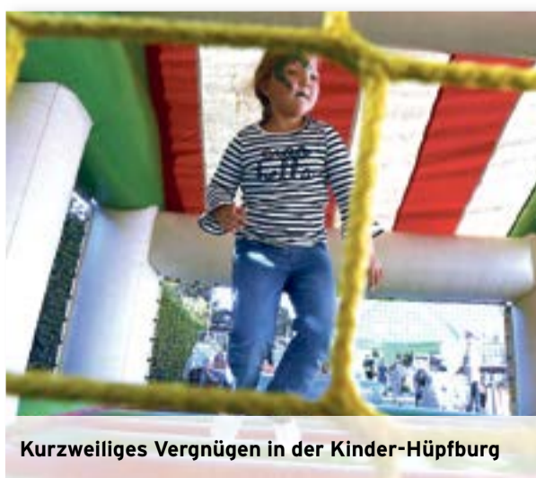
Kurzweiliges Vergnügen in der Kinder-Hüpfburg