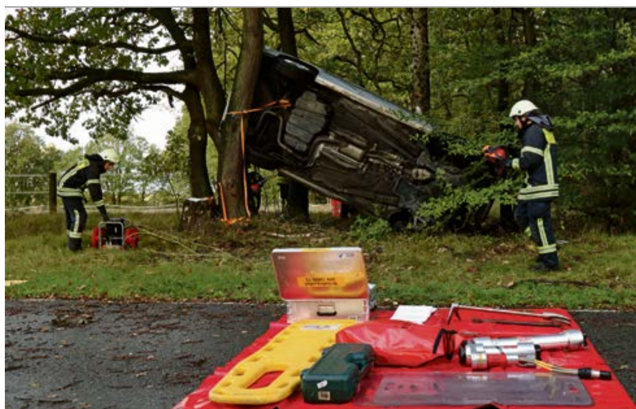
Eine Feuerwehrgroßübung Anfang November an der Ahsener Brücke verlangte 130 Kameradinnen und Kameraden der Wehren aus Olfen, Selm und Lüdinghausen Fachwissen und besonderen Einsatz ab.