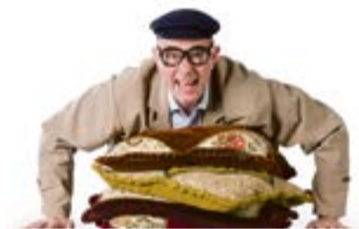
Herbert Knebel gastiert in Olfen.

Samstag, 22. August, Einlass ab 19.30 Uhr