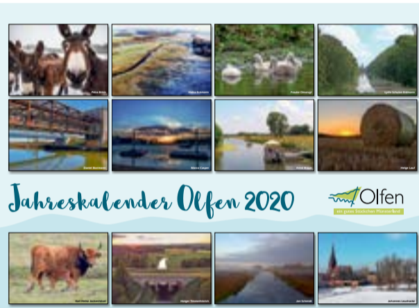
Jahreskalender Olfen 2020

„Wir freuen uns - nicht nur zu Weihnachten - über das große Interesse an unseren „Olfen-Produkten“. Auch im nächsten Jahr werden wir sicherlich wieder neue Ideen umsetzen, um jedem Bürger und den Gästen schöne Andenken bieten zu können.“