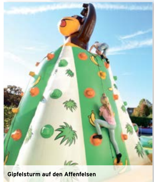
Gipfelsturm auf den Affenfelsen