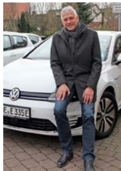
Vorstellung des E-Dienstwagens im Frühjahr 2019: Klima- und Naturschutz bleibt ein wichtiges Thema.

„Ein klares „Ja“ von mir. Wir sind gut aufgestellt und haben Rücklagen geschaffen, da es sich abzeichnete, dass die Zeiten schwieriger und die Aufgabenstellungen größer werden. Ein Beispiel dafür ist die Finanzierung der Menschen, die in Olfen als Flüchtlinge aufgenommen worden sind. Einige von ihnen sind mittlerweile in Olfen weitgehend integriert, haben z. T. eigene Wohnungen und auch Arbeitsverhältnisse aufgenommen. Problematisch ist die Situation mit denjenigen Flüchtlingen, deren Asylantrag abgelehnt wurde und die abgeschoben werden müssten. Hier passiert schlicht gesagt oft gar nichts. Da nach einem abgelehnten Asylantrag die finanzielle Unterstützung von Land und Bund nach drei Monaten ausläuft, muss die Stadt Olfen allein die Kosten tragen. In Zahlen ausgedrückt sind das