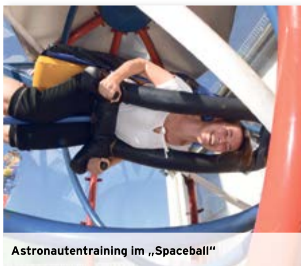
Astronautentraining im „Spaceball“