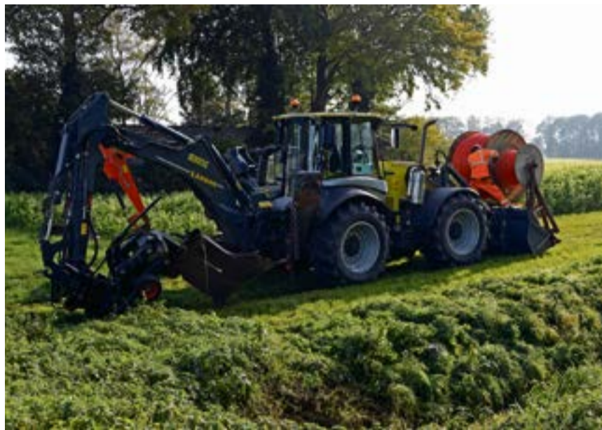
Eine Spezialmaschine sorgt derzeit für die zügige Verlegung des Glasfaserkabels im Außenbereich der Stadt Olfen auf einer Gesamtstrecke von 60 km.

Helfern und vor allem auch den Nachbarn an der Festwiese am Hafen. „Das harmonische Miteinander macht diese Veranstaltung zu etwas Besonderem.“