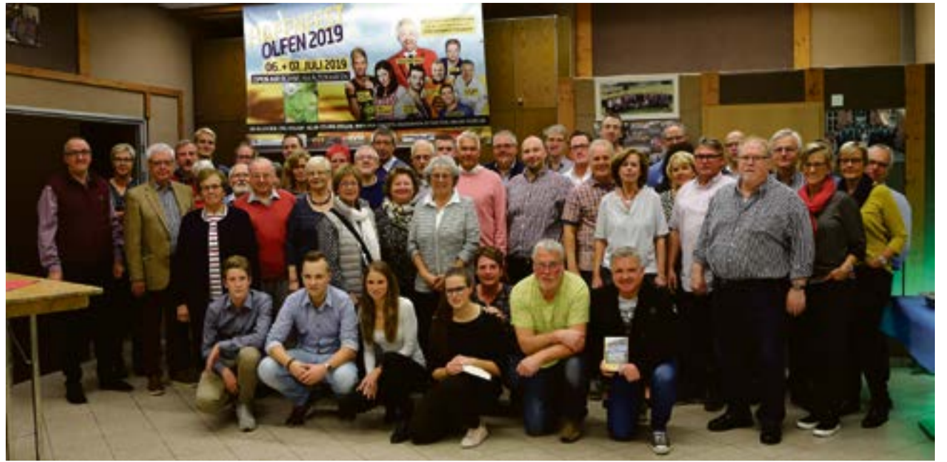
Gruppenfoto mit vielen der insgesamt 100 Helfern, die auch in diesem Jahr dafür sorgten, dass das Hafenfest trotz schlechter Wetterbedingungen wieder ein Erfolg wurde. 2021 wird es eine Neuauflage geben.

Überraschungsgast des Abends war Sänger und Moderator Günther Sturm aus Österreich, der wieder das Hafenfest begleitet hatte. „Ich hatte einen Termin in Düsseldorf und endlich einmal die Gelegenheit auch bei der Helferparty dabei zu sein. Ich bin