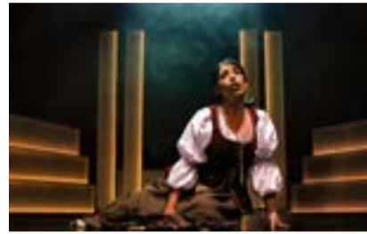
Ausschnitte aus „MUSICAL IN CONCERT“.

Der Preis für das Kulturabonnement beträgt 78,00 €. Die drei Veranstaltungen finden in der Stadthalle Olfen, Zur Geest 25, mit Anspruch auf einen Sitzplatz statt. Das Abonnement ist auch auf andere Personen übertragbar. Der Abonnementverkauf findet noch bis zum 6. Dezember 2019 statt. Erhältlich sind die Abonnements im Rathaus der Stadt Olfen, Tourismus- und Bürgerbüro, Kirchstraße 5 und online unter www.olfen.de Ab dem 9. Dezember 2019 sind die Karten für die jeweiligen Einzelveranstaltungen im Tourismus- und Bürgerbüro sowie online erhältlich.