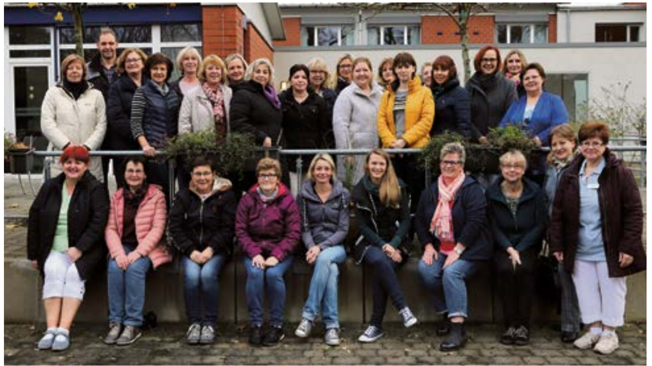
Ein Teil des Teams vom St. Vitus-Stift, das täglich und natürlich auch an Weihnachten für alle Bewohner da ist.

Ein Fundament, auf dem in den nächsten Jahren die Erweiterung von stationären Pflegeplätzen aufgebaut werden soll. „Die Fortschreibung des Pflegebedarfsplanes des Kreises Coesfeld hat festgestellt, dass der Bedarf an stationären Dauerplätzen in den nächsten Jahren drastisch steigen wird. „Laut Prognose werden bis zum Jahr 2030 80 zusätzliche Plätze benötigt“, so Stefanie Benting. Deshalb ist bereits jetzt eine Erweiterung des St. Vitus-Stiftes angedacht. Konkret werden sollen etwaige Pläne im Frühjahr 2020. „Zunächst wird die kreisweite Konferenz „Alter und Pflege“ im kommenden Jahr dazu beitragen, dass sich die einzelnen Kommunen