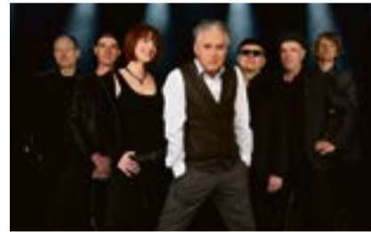
Die Band „Still Collins“

Dieses Konzert wird nur z.T. bestuhlt, sodass es keine Sitzplatzreservierung gibt.