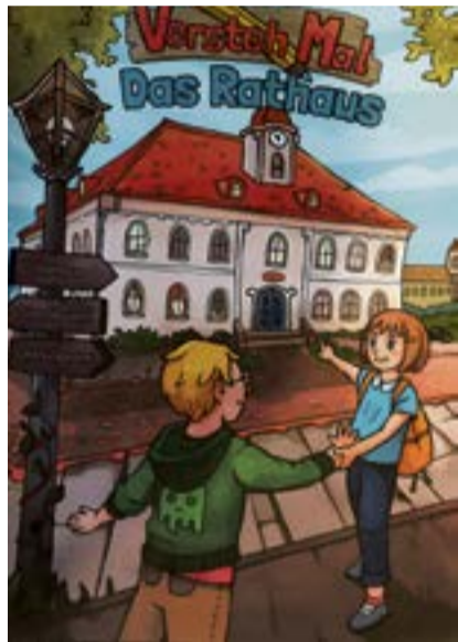
Ein neues Malbuch beschäftigt sich mit den Aufgaben innerhalb des Rathauses.

„Versteh Mal – Das Rathaus“ ist der Titel dieses Lernbuches, das mit Geschichten, Rätseln, Malvorlagen und sogar einem Beispiel dafür, wie man eine Forderung an die Stadtverwaltung stellt, viel Stoff zum Lernen und Verstehen von Vorgängen und auch der Politik bietet.