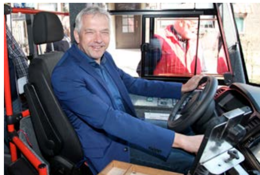
Probesitzen bei der Einweihung des neuen Bürgerbusses.

„Das können meine Frau und unsere Tochter, die seit einem Jahr mit ihrem Freund in Olfen auf eigenen Beinen steht, viel besser als ich. Ich bin nur für das Aufstellen des Baumes zuständig und dafür, dass er gerade steht. Ansonsten mögen wir in der Familie die weihnachtlichen Traditionen zu denen für uns unbedingt der Kirchengang und das Treffen mit der Familie dazugehören. Und natürlich gehört im Vorfeld auch der Besuch des Olfener Adventsmarktes dazu. Vielleicht fahren wir über den Jahreswechsel mit Freunden ein paar Tage weg, um für die Aufgaben in 2020 ein wenig aufzutanken.“