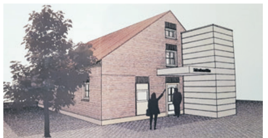
Das Heimathaus soll u.a. mit dem Anbau eines Aufzugs barrierefrei werden.

Die Geschäftsleitung freute sich derweil über das große Interesse der Besucher*innen, die viel Lob und Anerkennung für das neue Autohaus aussprachen. „Es ist geschafft und in diesen neuen Räumen kann die Zukunft kommen“, sind sich alle einig.