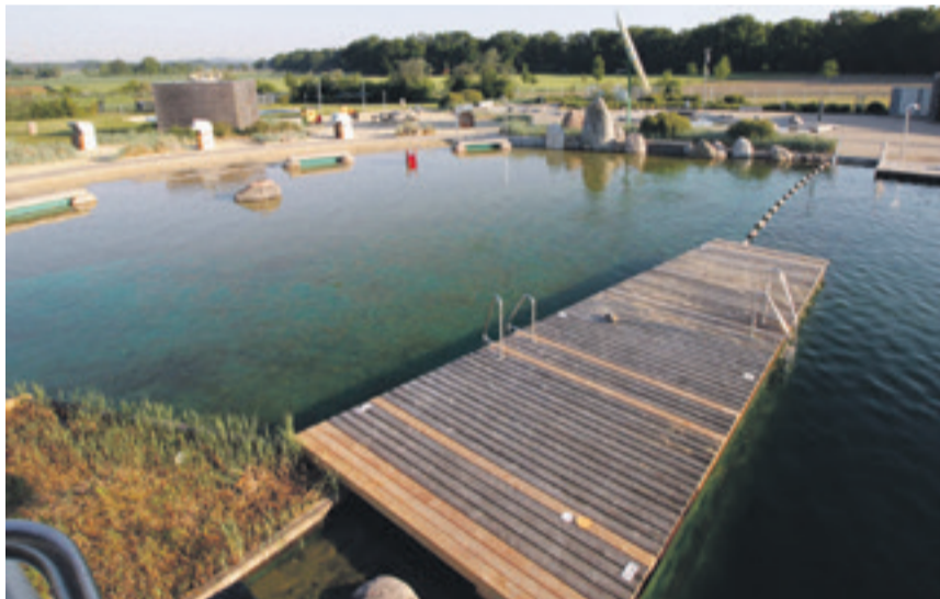
Im Naturbad stehen in den nächsten Jahren mehrere Sanierungsmaßnahmen an. Dazu gehört der Austausch der verschiedenen Holzdecks.