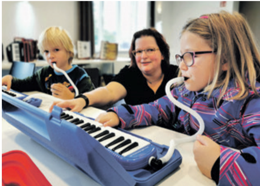
Die kleinen Tastenforscher konnten sich mit den Instrumenten vertraut machen.

Schon im September ging es dann los. An mehreren Tagen konnten Kinder zwischen 5 und 10 Jahren im Leohaus