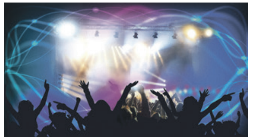
Ein Punkt im Maßnahmenkatalog: Schon im nächsten Jahr soll es im Rahmen der SummerSpecials eine Veranstaltung speziell für junge Olfener*innen geben.

„Bei fast allen Befragungen wird landes- oder bundesweit ermittelt. Dabei kommen nach unserer Ansicht die Unterschiede zwischen Land- und Stadtmenschen oft nicht zum Tragen. Hier wurden konkret junge Menschen einer Kleinstadt befragt, die sich nach eigenen Aussagen und im direkten Vergleich zu Stadtmenschen z.B. weniger Sorgen machen, weniger Existenzängste haben und sich weitaus mehr ehrenamtlich einsetzen.“ Aus ihrer Sicht und auch nach Gesprächen mit der Olfener Stadtspitze und der Olfener Politik sei diese Befragung eine Quelle der Inspiration für alle Bereiche des Lebens in Olfen gewesen, die nun genutzt wird.