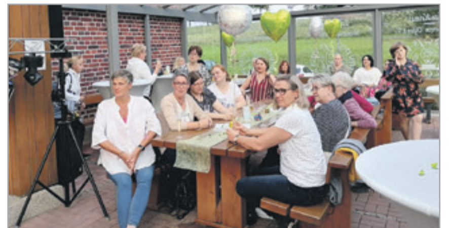
80 Mitarbeiter*innen kamen zum Corona-Dankeschönfest ins Heimathaus.

genheit, sich mit den Mitarbeiter*innen eingehend auszutauschen. Zum Abschluss der Veranstaltung waren sich alle einig. „So eine Feier sollte jedes Jahr stattfinden.“