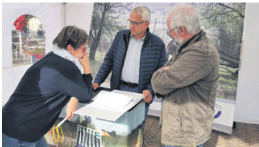
Die Bürgersprechstunde fand im Oktober auf dem Marktplatz statt.