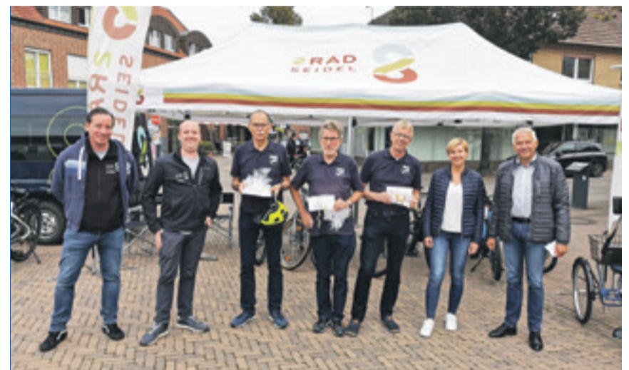
Die Sieger im diesjährigen Stadtradeln wurden jetzt ausgezeichnet.