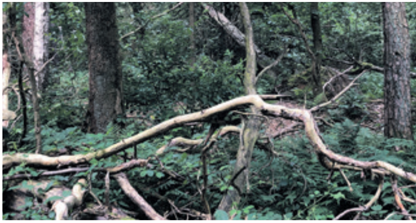
Statt „Hutewald“ könnte es jetzt ein „Wildnisgebiet Röhagener Heide“ geben.