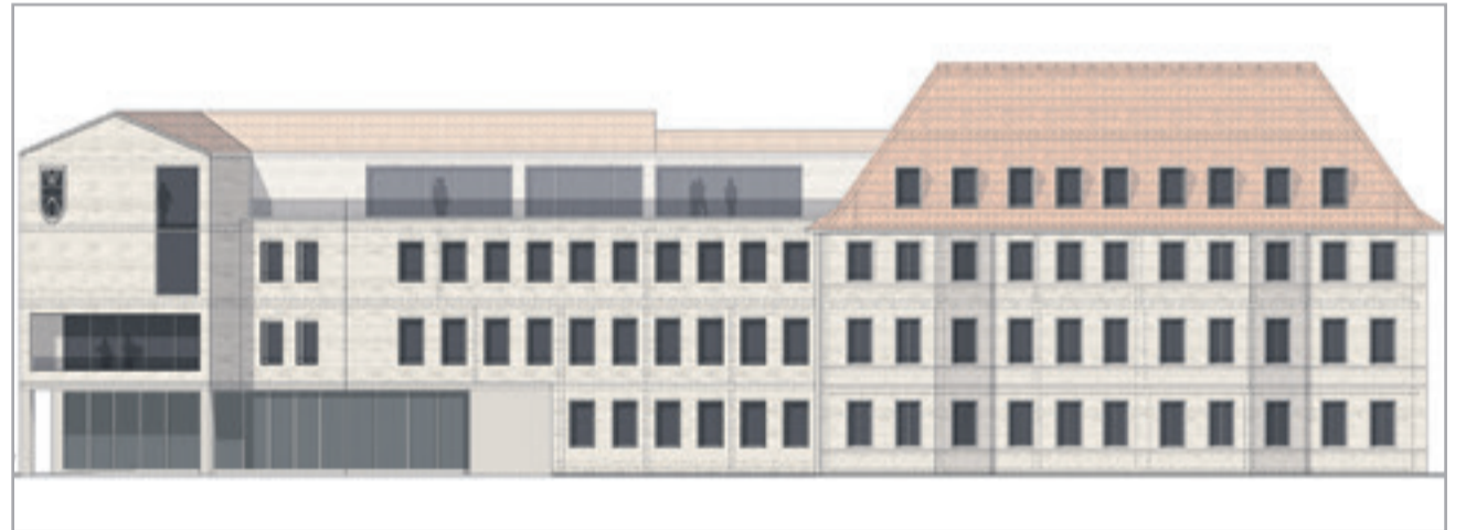
Die planerische Ansicht des neuen Rathauses gibt einen Eindruck davon, wie das neue und das alte Gebäude zusammengeführt werden sollen. Der linke Teil wird u.a. auch einen Ausstellungsbereich bieten.