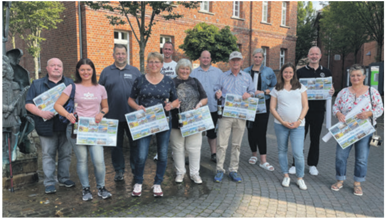
Auch in diesem Jahr sorgten wieder engagierte Hobby-Fotograf*innen für einen außergewöhnlichen Jahreskalender.