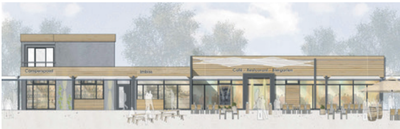
So sieht die Entwurfsplanung für eine neue Gastronomie am Naturbad im Rahmen des Baus des Wohnmobilstellplatzes aus.

„Nach jetzigem Stand soll mit dem Bau der Gastronomie zuerst begonnen werden, weil die Ausgrabungen in diesem Geländebereich bereits abgeschlossen sind“, so Schmalenbeck. Man gehe aber davon aus, dass die weiteren Arbeiten in Sachen Stellplatz dann zeitnah folgen können, sodass die Inbetriebnahme in beiden Fällen möglichst noch im Jahr 2022 stattfinden kann.