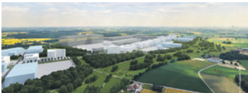
Ein virtueller Blick auf den geplanten newPark.

Alle Ideen und Anregungen werden derzeit aufgearbeitet, um sie schließlich mit den Ideen aus der Bürgerversammlung und den Hinweisen der einzelnen Ratsfraktionen abzugleichen. „Wir werden den Ideenkatalog nach Bereichen ordnen, um daraus einen möglichen Maßnahmenkatalog zu erstellen, der dann letztendlich von der Politik diskutiert und beschlossen werden soll“, erläutert Nowak das weitere Vorgehen. Zu dieser Entscheidungsfindung ist geplant, eine Sitzung zu terminieren, die sich ausschließlich mit diesem Thema beschäftigt.