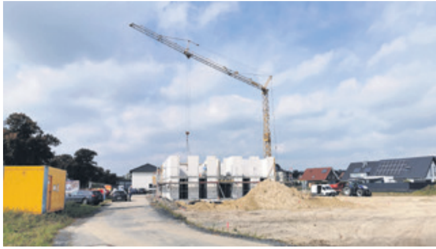
Das erste von acht Mehrfamilienhäusern an der Ächterheide ist im Bau.