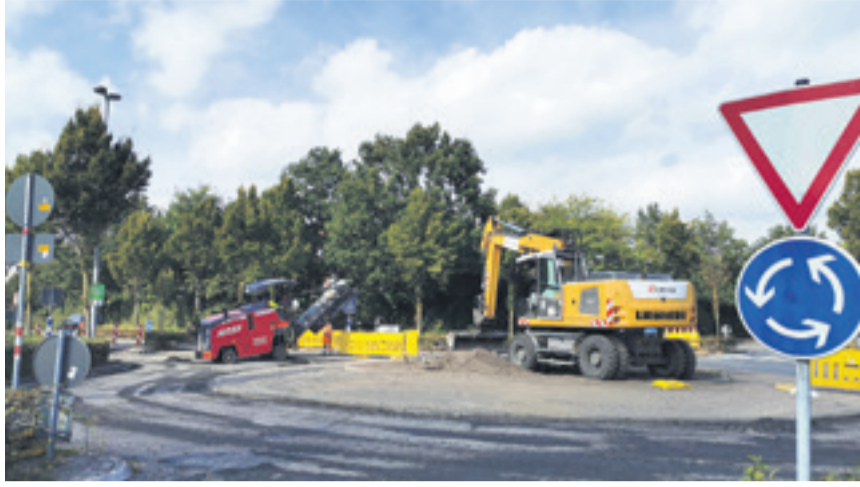
Der Austausch der Asphaltsschicht am Kreisverkehr gehörte zu den letzten Schritten der Eckernkampsanierung. Jetzt ist die Straße wieder freigegeben.

Die Straße „Eckernkamp“ ist nach umfangreichen Straßenbauarbeiten durch den Kreis Coesfeld wieder für den Verkehr freigegeben. Zuvor hatte der Kreis Coesfeld aufgrund von Asphaltarbeiten nicht nur den Eckernkamp selbst, sondern auch den Kreisverkehr an der Eversumer Straße, Kökelsumer Straße und Funnenkampstraße komplett gesperrt.